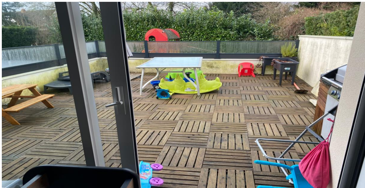
PHOTO D'ENSEMBLE AVANT TRAVAUX